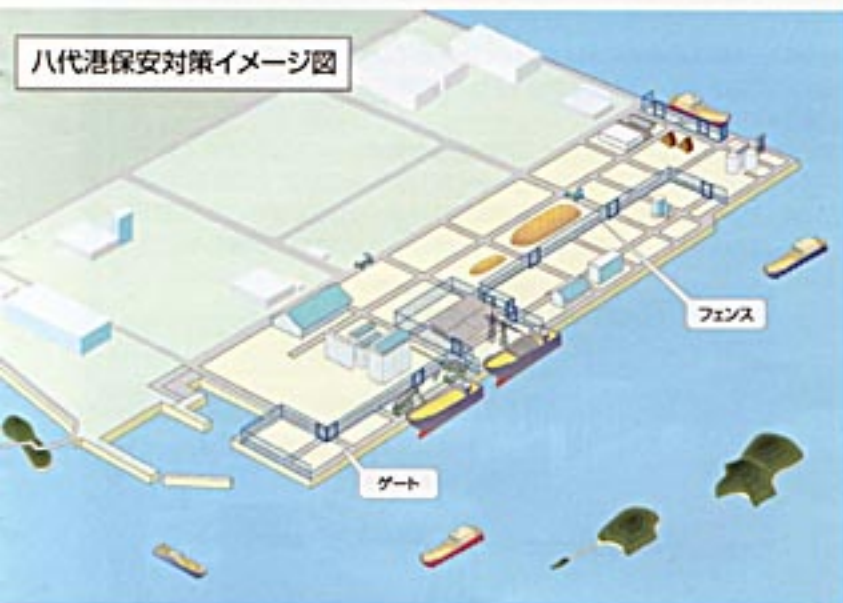
八代港保安対策イメージ図

最近の国際的犯罪組織による各種犯罪の多発や米国同時多発テロ事件を契機に、港湾の保安確保の要請が高まっています。これを受けて、海上人命安全条約(SOLAS条約)が改正され、平成16年7月1日に発効しました。このことにより、国際貨物船等が使用する港湾施設を対象に、破壊工作等の不正行為を防ぐため、保安対策を講ずることが必要となり、熊本県により、外国貿易が行われている八代港、熊本港、三角港において立ち入り制限区域が設けられました。