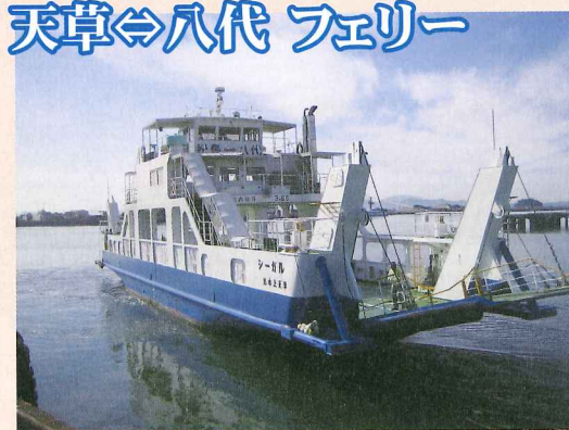
■天草八代フェリー時刻表