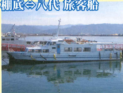
■りゅう丸運賃表 ※平成20年11月改正