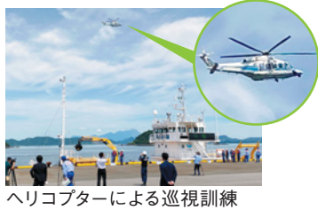
ヘリコプターによる巡視訓練

国土交通省・海上保安庁は、熊本県・八代市・熊本県港湾建設協会と合同で「八代港の耐震強化岸壁を使用した初の合同防災訓練」を実施しました。5年前の熊本地震で幸いにもほとんどの被害がなかった八代港は、自衛隊や海上保安庁、港湾局等の船舶による緊急物資輸送、給水・入浴支援など被災者支援に大きな役割を果たし、船舶が着岸する岸壁や広大なオープンス