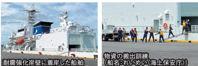
耐震強化岸壁に着岸した船舶