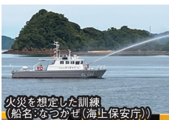
火災を想定した訓練 (船名: なつかぜ(海上保安庁))