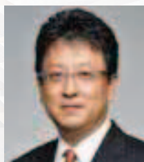
熊本港ポートセールス 協議会会長(熊本市長) 大西 一史

【主催】 八代港ポートセールス協議会、熊本港ポートセールス協議会、八代港湾振興協会、熊本港振興協会、熊本県、八代市、熊本市