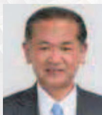
八代港ポートセールス 協議会会長(八代市長) 中村 博生