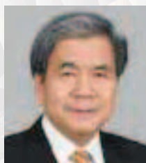
熊本県知事 蒲島 郁夫

熊本県知事、八代市長、熊本市長による県内港のPRや各種助成制度等の御紹介、県内港利用企業等による事例発表のほか、TSMCの熊本進出に伴う半導体関連企業の進出動向等も取り入れたものとなりますので、皆様の御参加をお待ちしています。