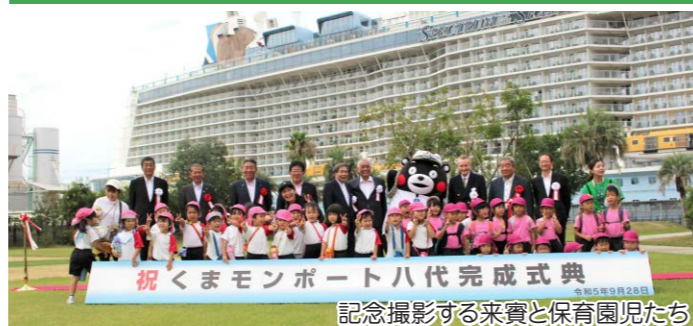
祝くまモンポート八代完成式典 記念撮影する来賓と保育園児たち

くまモンポート八代完成記念式典が9月28日にくまモンポート八代で開催されました。新型コロナウイルスの影響で約3年半延期されていた式典でしたが、当日は国や県、市などの関係者ら約130人が出席し、念願のグランドオープンとなりました。この日は、ロイヤル・カリビアン社のクルーズ船「スペクトラム・オブ・ザ・シーズ」が寄港し、大漁旗を掲げた漁船や秀岳館高校生生徒による雅太鼓で乗船客をもてなしました。