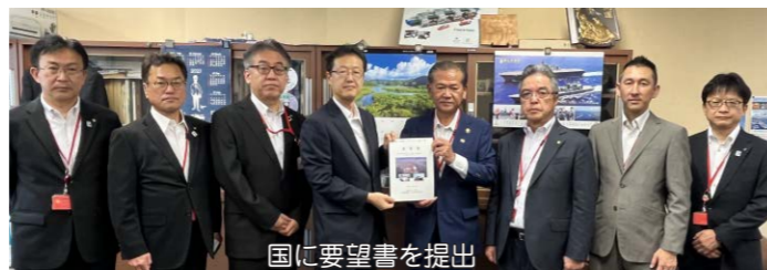
国に要望書を提出