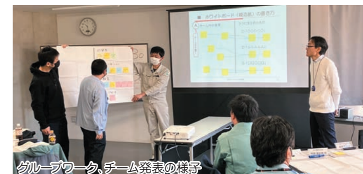
グループワーク、チーム発表の様子

今回は、高齢・障害・求職者雇用支援機構熊本支部 熊本職業能力開発促進センターおよび日本能率協会のご協力のもと、Dソリューション研究所様を講師としてお招きしました。講座では、ティーチングとコーチングの違いや、それらを活用した指導法・手法について学びました。