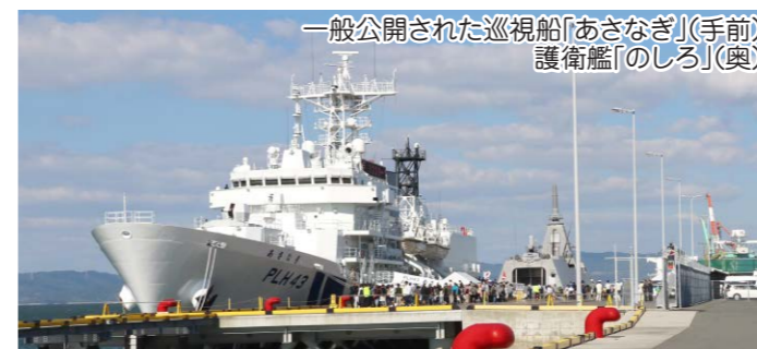
一般公開された巡視船「あさなぎ」(手前) 護衛艦「のしろ」(奥)

その他、くまモンポート八代内では、陸上自衛隊装備品展示のほか、消防車やパトカーなどはたらきかい展、グルメや物産ブースなどもあり、多くの人でにぎわいました。