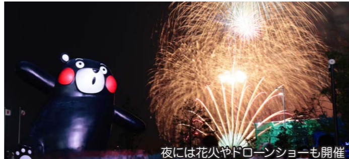
夜には花火やドローンショーも開催

くまモンポート八代完成記念式典が9月28日にくまモンポート八代で開催されました。新型コロナウイルスの影響で約3年半延期されていた式典でしたが、当日は国や県、市などの関係者ら約130人が出席し、念願のグランドオープンとなりました。この日は、ロイヤル・カリビアン社のクルーズ船「スペクトラム・オブ・ザ・シーズ」が寄港し、大漁旗を掲げた漁船や秀岳館高校生生徒による雅太鼓で乗船客をもてなしました。